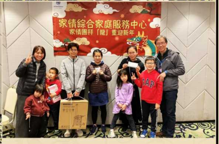
家情團拜「龍」重迎新年