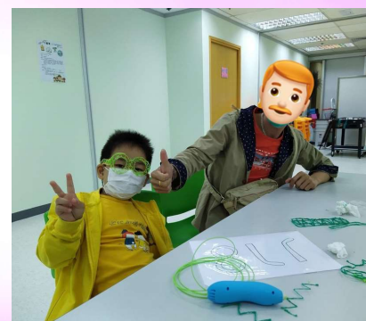
親子3D立體筆： 齊齊整立體眼鏡