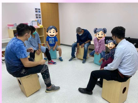
親子木箱鼓體驗班

中心舉辦了不同親子活動，讓家長和兒童一同參與，過程中更促進親子間的溝通與合作，享受快樂的時光！