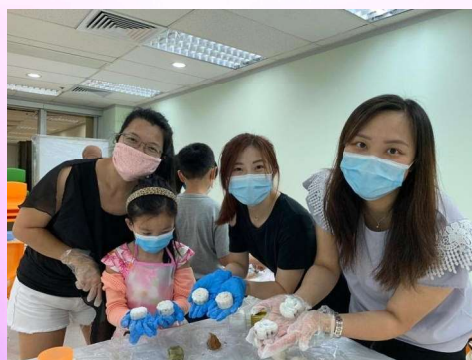
親子冰皮月餅製作